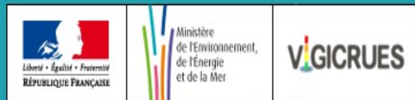
Plate-forme nationale collaborative des sites & repères de crues

Plateforme nationale collaborative des sites et repères de crues